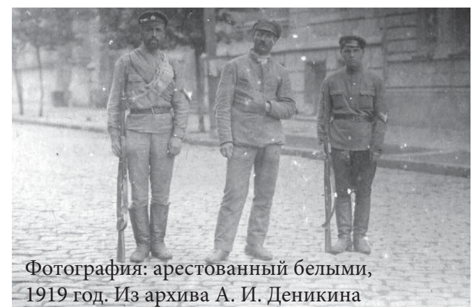
Фотография: арестованный белыми, 1919 год.

dzen.ru/?yredirect=true&clid=2372573&win=566