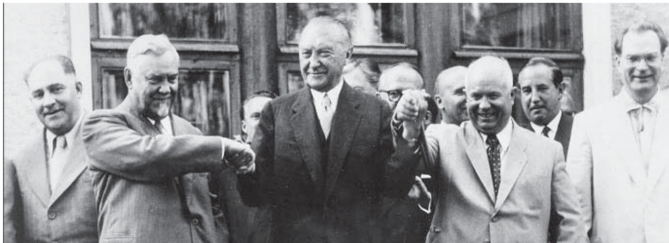
Хрущев и Булганин с Конрадом Аденауэром в Москве.