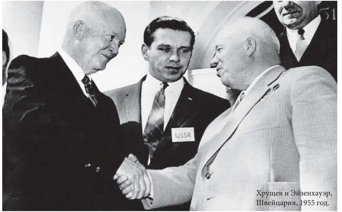
Хрущев и Эйзенхауэр, Швейцария, 1955 год.

Важнейшим моментом Декларации была судьба острова Шикотан и островов Хабомаи - они должны