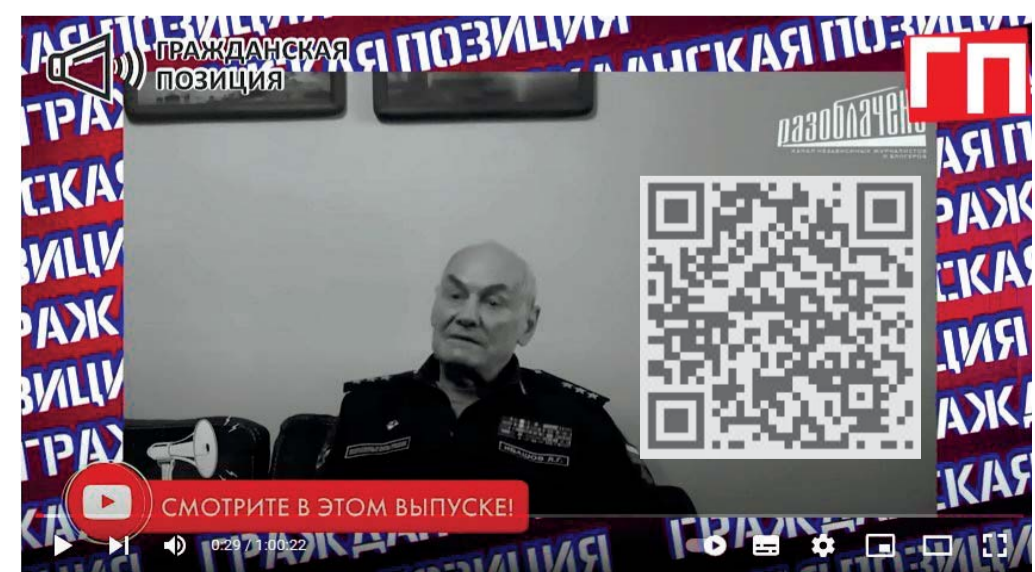
ГЕНЕРАЛ ИВАШОВ Ш*КИРОВАЛ ВСЕХ! РАЗВАЛ АРМИИ! ПУТИН ОКОНЧАТЕЛЬНО ПРОДАЛ СВОЮ СТРАНУ! КРАХ РОССИИ!

Воевать должны ПРОФЕССИОНАЛЫ !!!! Хотите иметь сильную профессиональную Армию, - верните Военные Училища вместо Полу-военнообразованных Институтов ! Верните НОРМАЛЬНЫЕ Сроки службы ! НЕ допускайте в Армию блатных Детей всяких "дерипасок" ! Набирайте в Военные Училища БЕСПЛАТНО !!!!!!!!!!!!!!!!!!!!!!!!!!!!!!!!!!!!! Принимайте Детдомовских и Детей-Сирот ! Верните ИДЕОЛОГИЮ в Конституцию ! Верните БЕСПЛАТНОЕ Обучение и Медицину !! И Народ - ПОРВЁТ Любого Врага за такую Родину !